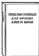
Choses dans lesquelles il est impossible à Dieu de mentir

Pour vous aider en ce sens, nous vous recommandons vivement la lecture du livre intitulé: