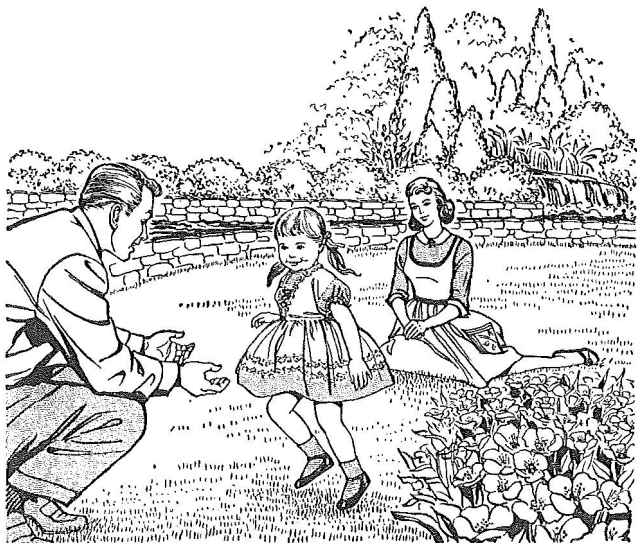
Les enfants naîtront dans la justice

51 Le mariage, cependant, ne sera pas le seul moyen utilisé pour remplir la terre de sujets justes du Royaume de Dieu. La mise au monde d'enfants par le mariage honorable des survivants d'Har-Magedon et des enfants de ces survivants, ne sera, semble-t-il, autorisée par le Roi que pour un temps limité dont nous ignorons la